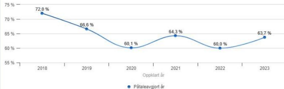
8.3 - Oppklaringsprosent per år og krimtype