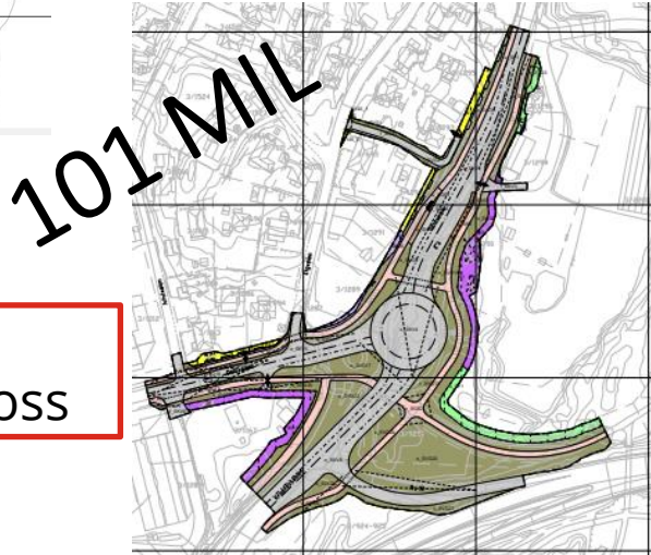
Kryssløsning Tigerplassen Moss