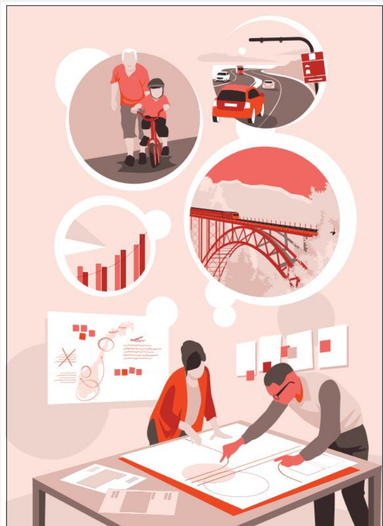
Figur 4.1 Mer for pengene i transportsektoren